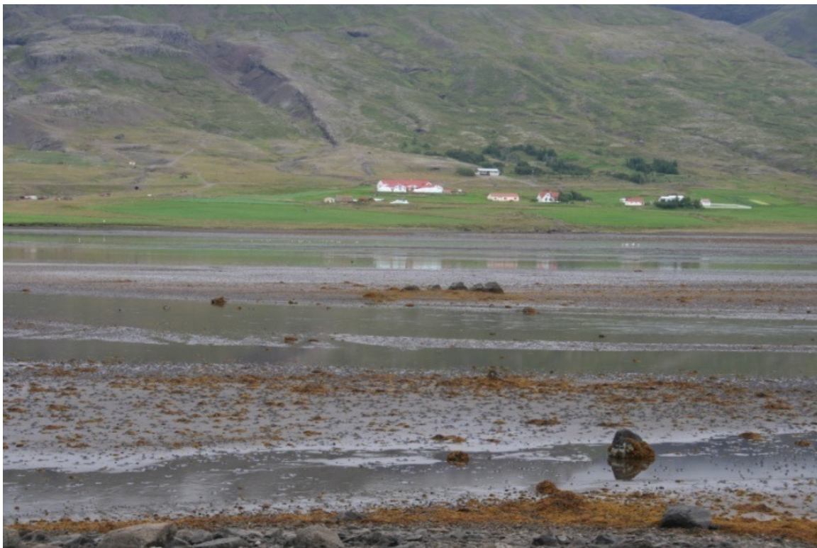
Mynd 2. Umhverfi leirunnar í Berufirði