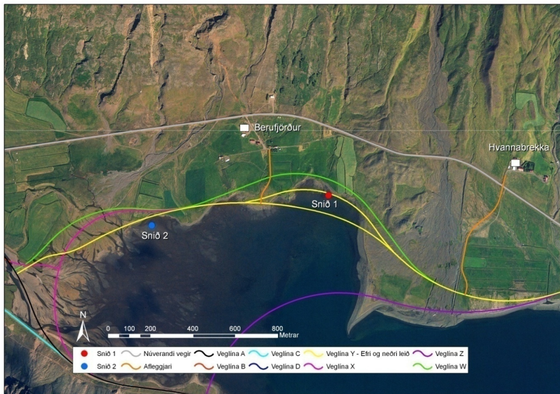
Mynd 1. Staðsetning sniða á leirum í Berufirði ásamt fyrirhuguðum veglínunum í botni Berufjarðar.